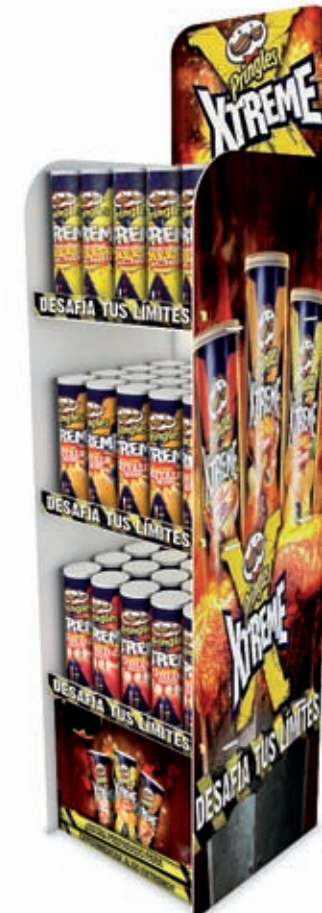
Présentoir de comptoir