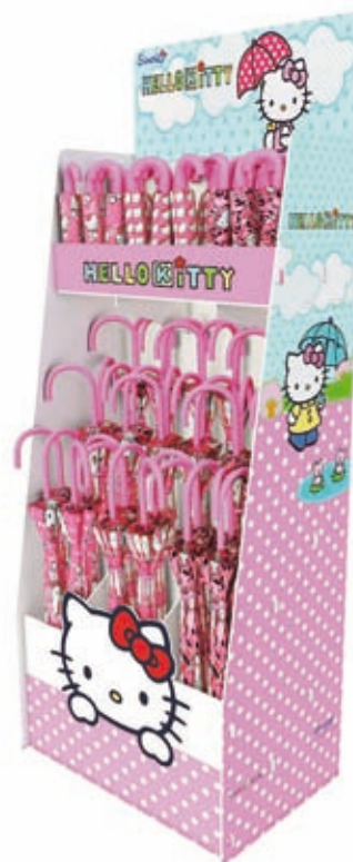
Présentoir type Box Palette avec étagère supérieure