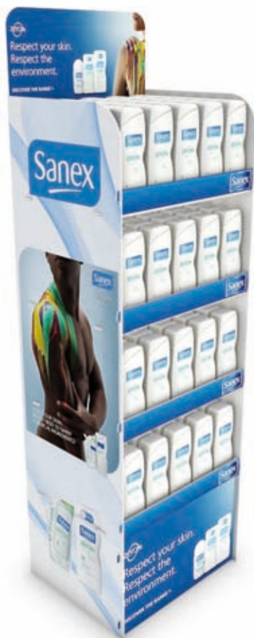
Très grande capacité de stockage