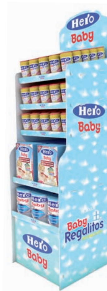
Hauteur plateaux adaptable au produit