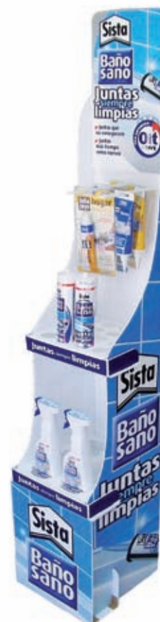
Plateaux matricés pour produits et crochets pour blisters