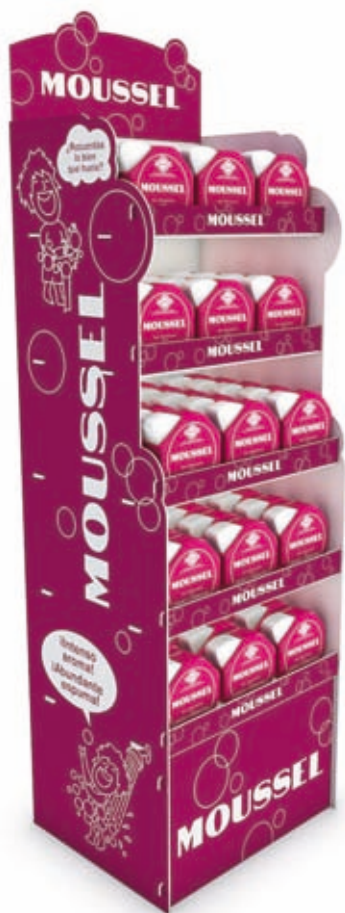
Silhouette présentoir personnalisable